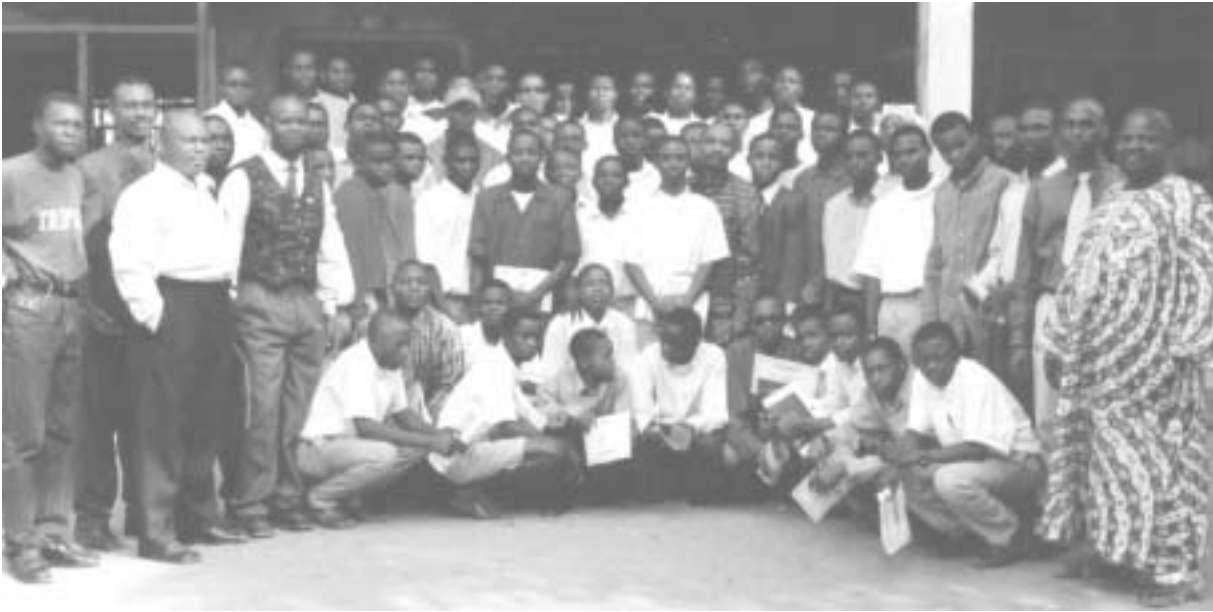
Les 2 000 diplômés de CMA étant en général exceptionnellement compétents et influents, l'effet du programme est considérablement multiplié.